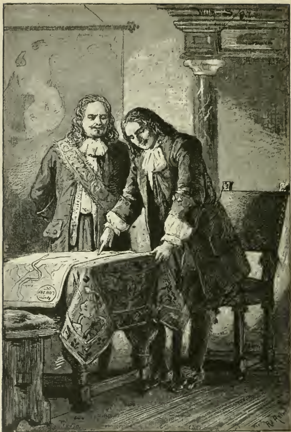
Pag. 201 legde hem de kaart van Londen voor.